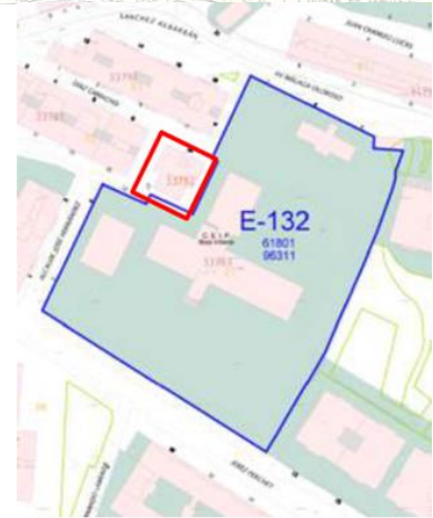
Plano de Patrimonio

Además se confirma comprueba con el Servicio de Patrimonio que la parcela de equipamiento no incluye el edificio de vivienda en su ámbito.