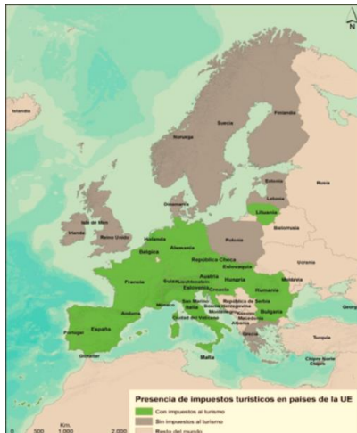
TASAS POR PERNOCTACIÓN EN DESTINOS

Acta de la sesión ordinaria 11/2019 de 16 de diciembre de 2019