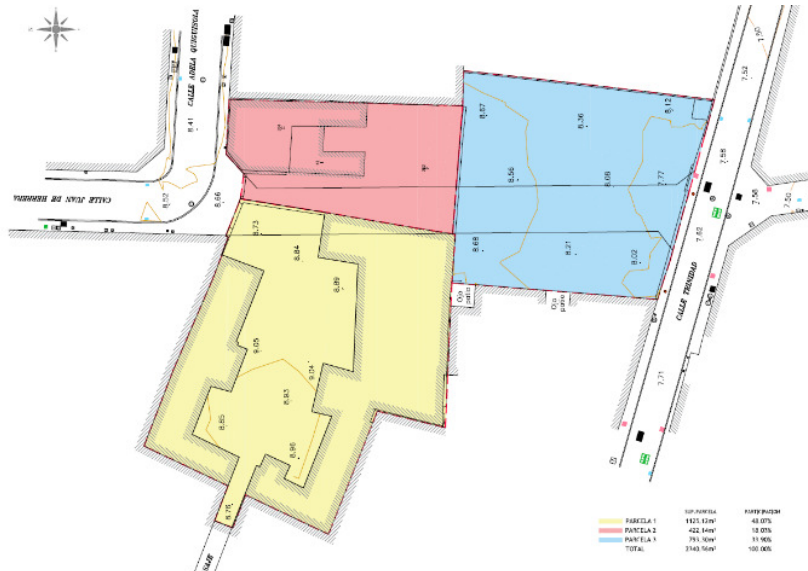
Parcelas aportadas en la documentación aprobación inicial

Modificación en la estructura de la propiedad: en la documentación de la aprobación inicial se recogían las parcelas aportadas iniciales que pueden verse en el gráfico: