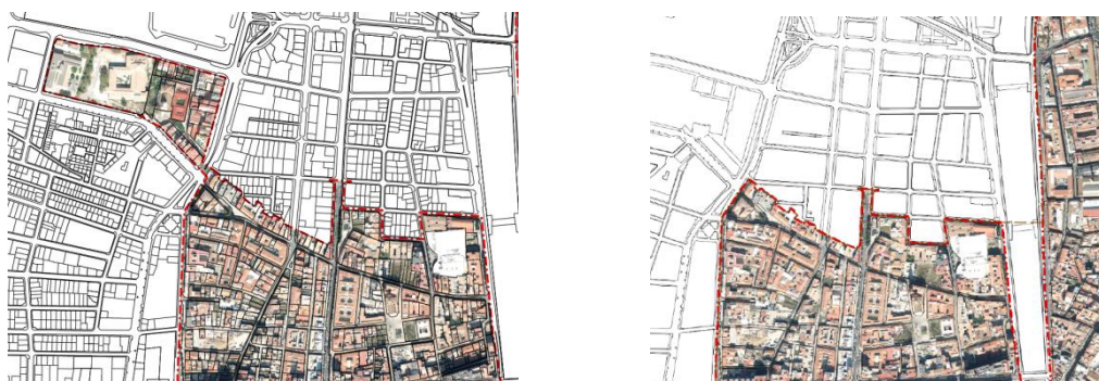
Propuesta incluyendo manzana Convento de la Trinidad Delimitación en Borrador de la ME sometido a EAE

En relación a dicha observación se ha modificado el ámbito previsto, incluyendo los ámbitos del Convento de la Trinidad ampliando la Zona 21 Trinidad/Perchel Norte.