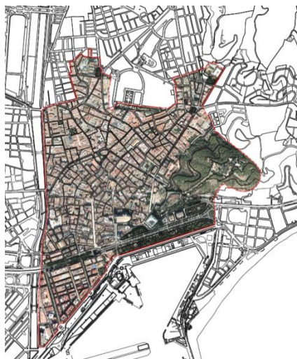
Ámbito PEPRI PGOU 2011

La modificación del ámbito del PEPRI propuesto es el que se observa en las imágenes siguientes