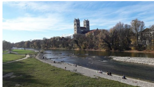
Renaturalización de Río Los Ángeles. Los Ángeles, (Estados Unidos). Río urbano Isar, en Munich (Alemania)