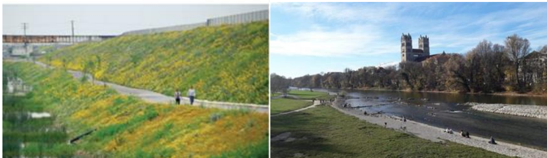
Renaturalización de Río Los Ángeles. Los Ángeles, (Estados Unidos). Río urbano Isar, en Munich (Alemania)

Revertir espacios degradados como las riberas del cauce del Guadalmedina será un beneficio impagable para la demanda ciudadana para cuyo proyecto además contemplamos una inversión muy inferior al de encajonar el río en hormigón, enjaularlo con un embovedado. Desde el Grupo Municipal Socialista defendemos esto tras examinar los trabajos de los últimos años con planes en marcha para la recuperación como el Parque Fluvial del río Besòs, la Malla Verde en Barakaldo, el Parque Universidad y Parque Isuela en Huesca y el Madrid río. También lo vemos en la renaturalización del río Manzanares a su paso por Madrid, el proyecto del Turia en Valencia y otros ejemplos internacionales que merecen mención, como el río Los Ángeles en Estados Unidos y el río urbano Isar, en Munich (Alemania). De hecho, según la Cuenca Hidrográfica del Júcar la renaturalización del Turia lleve un caudal de 400 litros por segundo de manera constante a su paso por la capital valenciana, un dato muy importante a tener en cuenta.