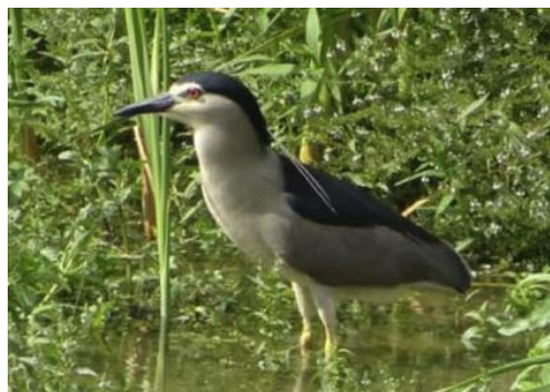
Imágenes del río Manzanares en Madrid y la recuperación de fauna.

Y volvamos a nuestra ciudad, a Málaga y a nuestro Guadalmedina, uno de los elementos naturales que sumado al patrimonio del monte Gibralfaro y al mar Mediterráneo que baña nuestras costas aupán con orgullo a la capital como uno de los focos de atracción turística más importantes de Andalucía. Pero insistimos en que el trato político a nuestro Guadalmedina debe ser afeado, porque en sus márgenes se han realizado desde las últimas dos décadas actuaciones de urbanización que no han