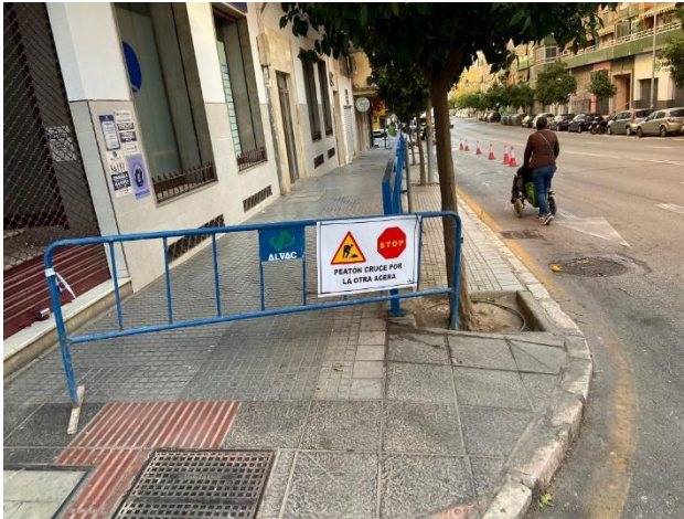
C/Blas de Lezo, nº5 (arriba) Blas de Lezo, nº4 (derecha)

Por parte de los vecinos y residentes del DISTRITO BAILÉN-MIRAFLORES, C/ BLAS DE LEZO , se nos ha hecho llegar la actual situación de la Calle Blas de Lezo en relación a las obras de mantenimiento del acerado de la misma.