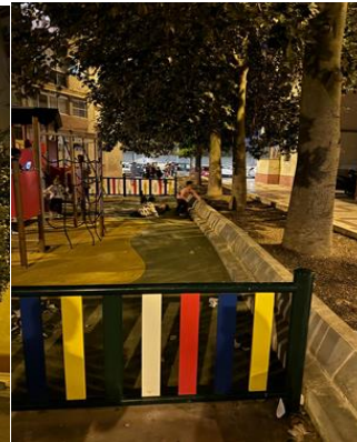
*Bordillos sin protección