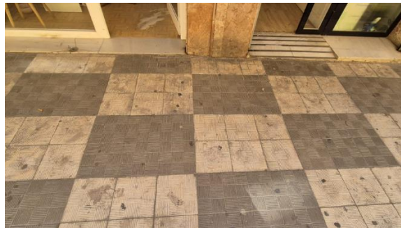
CALLE JONÁS. SUCIEDAD EN LA ACERA