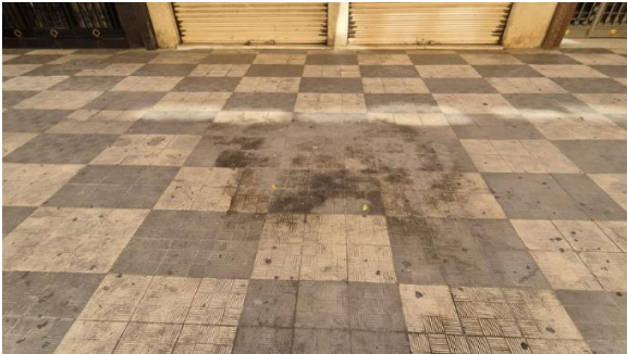
CALLE JONÁS. SUCIEDAD EN LA ACERA