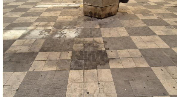
CALLE JONÁS. SUCIEDAD EN LA ACERA