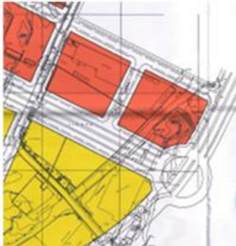
SUP-LO.2, ámbito del Polígono 2

La parcela de referencia catastral 0403301UF7600S0001TR, pertenece al ámbito PAM-LO.2 (97) del vigente PGOU-2011. El instrumento que establece la ordenación detallada de la parcela el Plan Parcial de Ordenación (en adelante PPO) LO.2 “Finca El Pato”, ámbito UE-2, (PL 59/2007), la posterior Modificación del PPO, aprobada en fecha 24/02/2011 y corregido posteriormente a través de la Corrección de errores (PL 47/2011) aprobada en fecha 18/01/2012. Es decir, estamos en un planeamiento aprobado y a la vez modificado del PGOU-1997. Según lo establecido en el cuadro de zonificación de la Modificación del PPO, su calificación es de Equipamiento destinado a uso de interés público y social (SIPS). La parcela cuenta con la urbanización ejecutada y el resto de parcelas incluidas en el ámbito están en proceso de ejecución de la edificación.