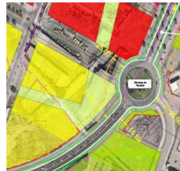
Estudio de Delimitación Tramo Urbano